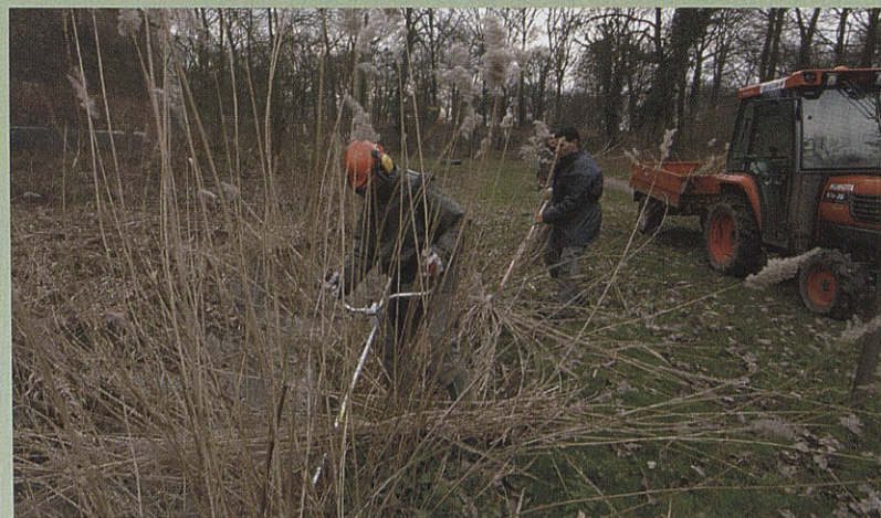
Une équipe a été mise en place pour réaliser l'entretien régulier des lieux et les aménagements programmés.