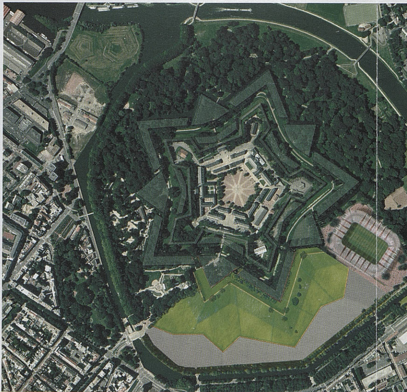
Demain, la Citadelle, l'Esplanade, le stade, un ensemble cohérent et harmonieux