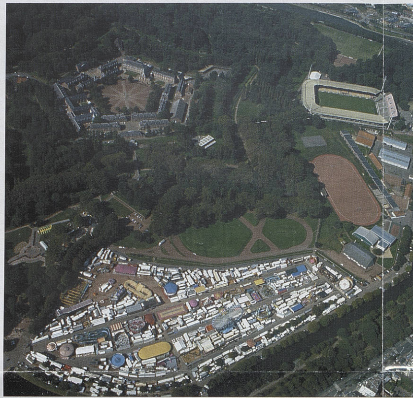
La Citadelle aujourd'hui