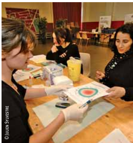
À Lille-Sud, un parcours a été proposé par le service Santé de la Ville afin de mesurer les risques cardio-vasculaires.