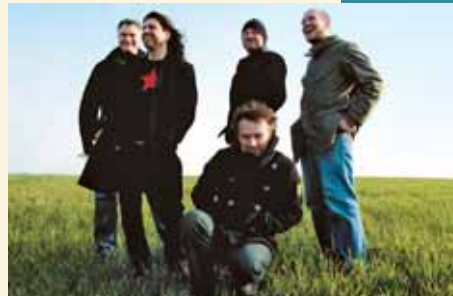
Les « Mauvaises Langues ».

Enfin, comme chaque année, pendant toute la durée des Fêtes d'Hellemmes, les attractions foraines avec leurs manèges, jeux d'adresse, gaufres, croustillons et autres confiseries prendront possession de la place Hentgès pour la plus grande joie des petits et des grands aussi !!! ■