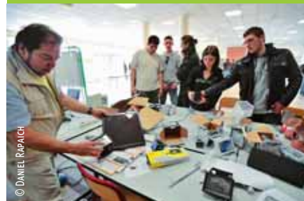
© DANIEL RAPAICH Journées Portes ouvertes en avril.