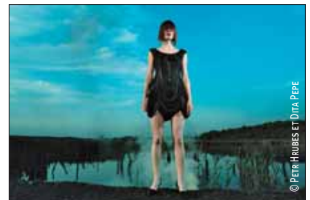
Bodysofa black fin