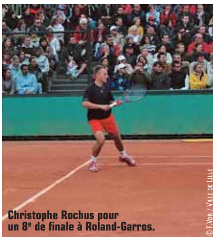
Christophe Rochus pour un 8 e de finale à Roland-Garros.