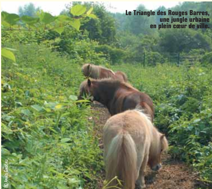
Le Triangle des Rouges Barres, une jungle urbaine en plein cœur de ville.

Renseignements et réservations à l'office de tourisme de Lille, place Rihour, 08 91 56 20 04 ou www.lilletourism.com