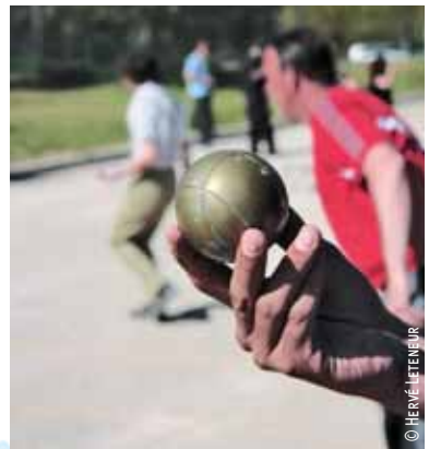
La Waz Pétanque Cup