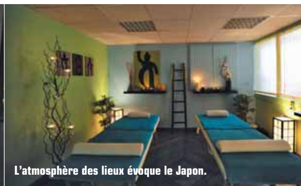
L'atmosphère des lieux évoque le Japon.