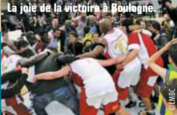
La joie de la victoire à Boulogne.