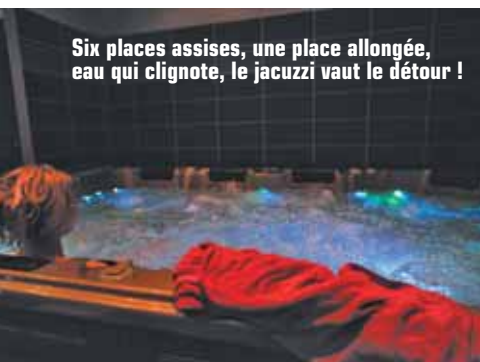
Six places assises, une place allongée, eau qui clignote, le jacuzzi vaut le détour !

Le Centre, 4 avenue de Bretagne, 03 20 92 17 04.