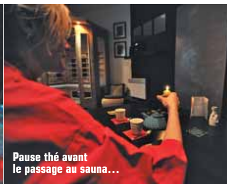
Pause thé avant le passage au sauna...