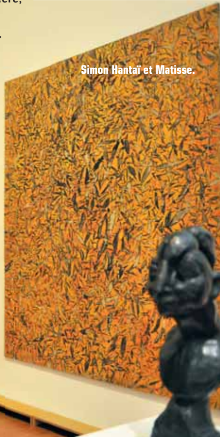
Simon Hantaï et Matisse.