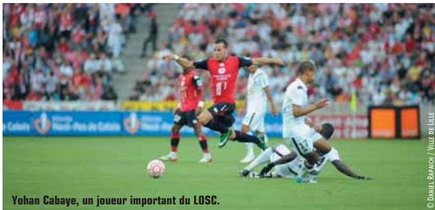
Yohan Cabaye, un joueur important du LOSC.