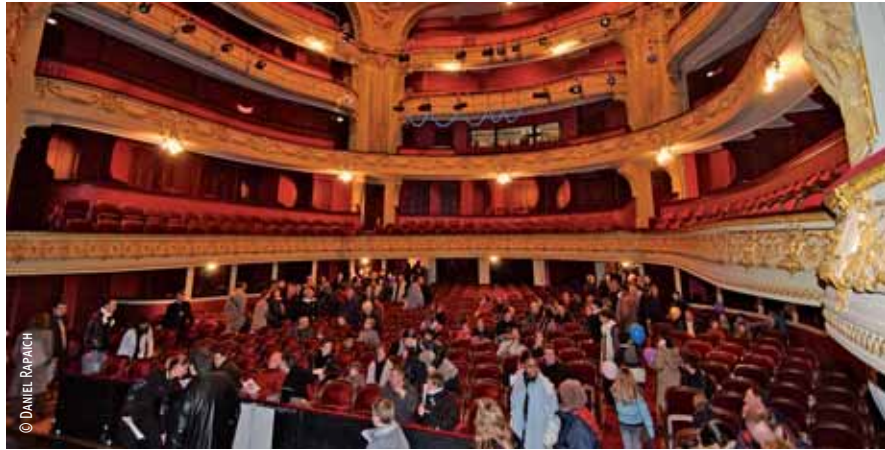
Découvrir l'Opéra, toujours un moment fort pour qui n'en a jamais franchi la porte !