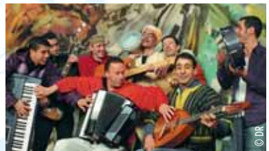
L'Orchestre National de Barbès