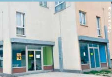
C'est dans le secteur Magenta-Fombelle que ce café pas tout à fait comme les autres a ouvert ses portes.

Café social et solidaire, 5, rue Magenta, 03 20 13 71 92