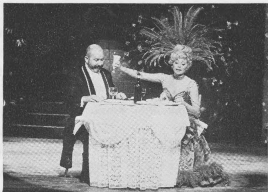
Jacques MAREUIL - Annie CORDY

Ensuite, Dolly, vamp étonnante, envoûtera notre grainetier au cours d'une soirée mémorable au grand restaurant Harmonia Palace, où Dolly était jadis une habituée aimée de tous.