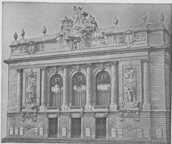
L'OPÉRA DE LILLE