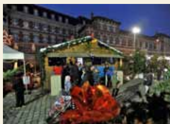
Pour sa 6 e édition, Lille Neige a accueilli encore plus de monde que l'année précédente. Près de 35 000 visiteurs sont venus profiter des nombreuses activités mises en place gare Saint-Sauveur, autour des patinoires, des pistes de luge et des chalets.