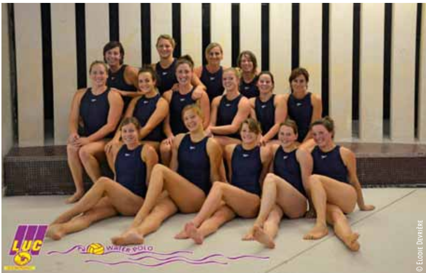
Les filles du LUC Métropole Water-polo.

L'apprentissage, la formation sont des maîtres mots au sein du club. Un club qui accueille des jeunes pousses dans le cadre des Centres Municipaux d'Initiation