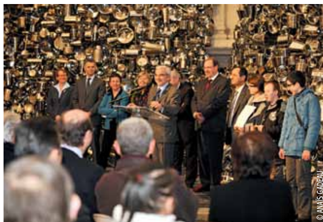
Au Vieux-Lille, le 12 janvier.

Comme chaque année en janvier, les président(e)s de Conseils de quartier présentent leurs vœux à la population dans chacun des quartiers. Un moment convivial, mais aussi l'occasion de faire le point sur l'avancée des projets. Vous en trouverez le compte rendu dans les éditions de quartier de Lille magazine .