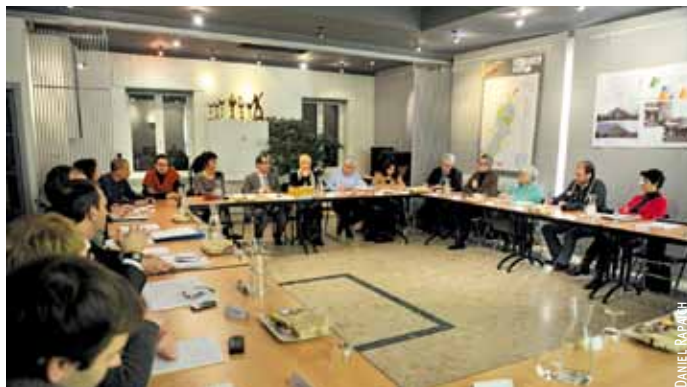
Réunion à Vauban-Esquermes.

Le renouvellement est prévu par le règlement intérieur. Il concerne les trois collèges qui composent les conseils : le « collège politique », le « collège des forces vives » et le « collège des habitants tirés au sort ». Il y a 77 nouveaux, une grande majorité des conseillers en place ayant souhaité poursuivre leur engagement dans leur quartier. On compte 193 « reconduits » sur 300, ce qui est le