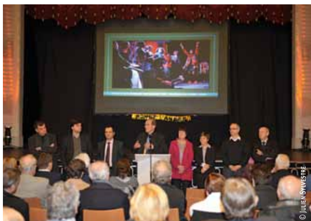
À Fives, le 11 janvier.