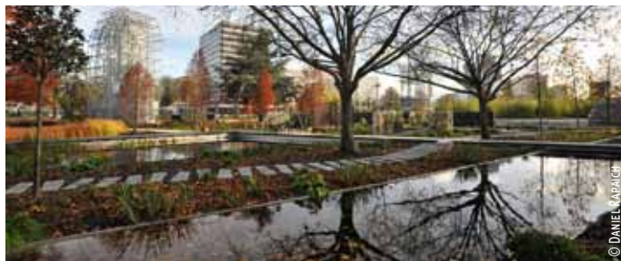
L'eau est le fil conducteur du lieu.