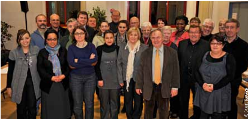
Le nouveau Conseil de quartier de Fives.