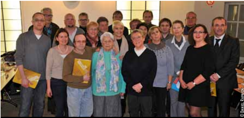
Le nouveau Conseil de quartier de Vauban-Esquermes.