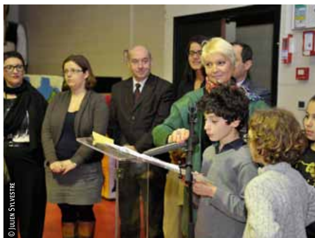
À Vauban-Esquermes, le 13 janvier.