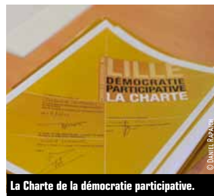
La Charte de la démocratie participative.

La vitalité de la démocratie lilloise s'est traduite récemment par le renouvellement des conseillers de quartier, arrivés au terme de leur mandat de trois ans et l'entrée de nouveaux Lillois dans ces conseils.