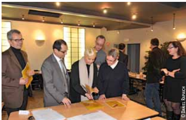
Les conseillers de quartier sont les premiers à signer la « Charte de la démocratie participative ».