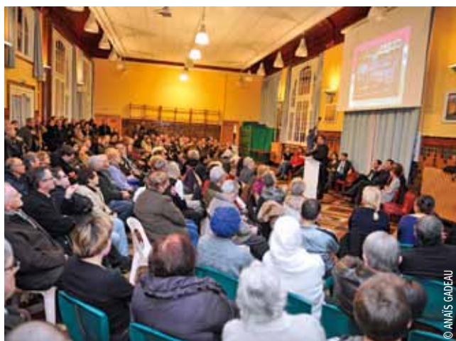
Aux Bois-Blancs, le 10 janvier.