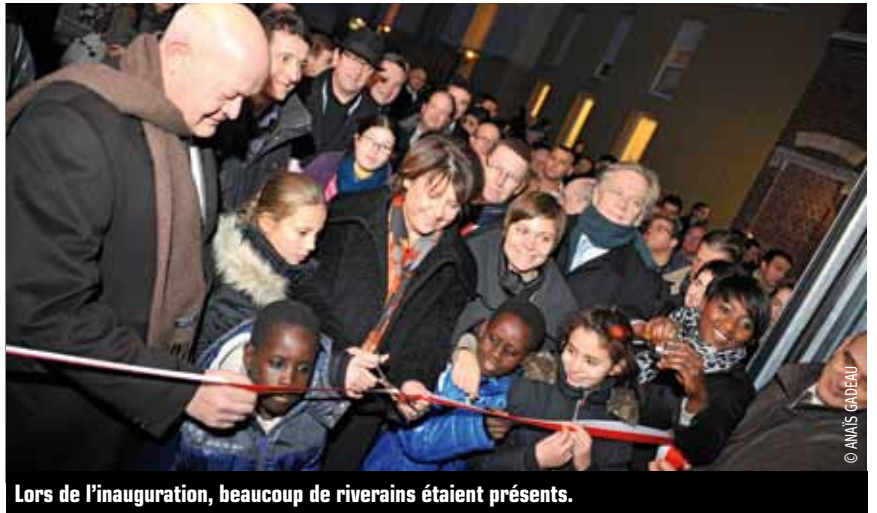
Lors de l'inauguration, beaucoup de riverains étaient présents.

À l'angle des rues de Jenner et de Flers, à Fives, la Ville de Lille, Lille Métropole Habitat et Escout Habitat ont inauguré deux nouvelles résidences.