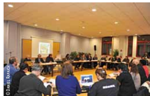
Réunion à Fives.

Lieu de concertation et d'information , le Conseil de quartier est un relais important entre le Maire, les élus municipaux et les habitants. Outil incontournable de la démocratie, le Conseil de quartier participe activement aux décisions publiques, il reflète le dynamisme de la Ville à impliquer ses citoyens. Ses conseillers donnent leur avis, discutent avec les élus et proposent des projets. Ils participent au quotidien à l'animation et à l'évolution du quartier afin d'améliorer le mieux vivre ensemble.