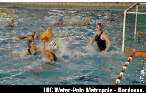
LUC Water-Polo Métropole - Bordeaux.