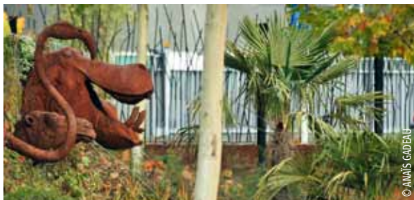
Les têtes cracheuses.

Jardin des Géants : 1, rue du Ballon à Lille. Ouvert tous les jours. L'hiver de 8 h à la tombée de la nuit ; l'été de 8 h à 22 h. Entrée gratuite.