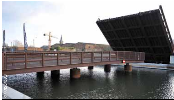
Les futures navettes fluviales pourront naviguer puisqu'il s'agit d'un pont levant.

Le nouveau pont, quai Hegel (côté jardin d'eau et grande pelouse devant l'ancien bâtiment Le Blan Lafont), établit un lien direct entre le quartier des Bois-Blancs à Lille et celui du Marais à Lomme, face à EuraTechnologies , en plein cœur du projet des Rives de la Haute Deûle. S'inscrivant dans le cadre des aménagements réalisés par la SORELI dans ce secteur, ce pont enjambe l'un des bras de la Deûle (Bras de Canteleu) pour permettre la continuité de la navigation fluviale. Cet ouvrage, accessible à tous les modes de déplacement, s'inscrit dans la continuité des nouveaux espaces urbains créés pour améliorer la