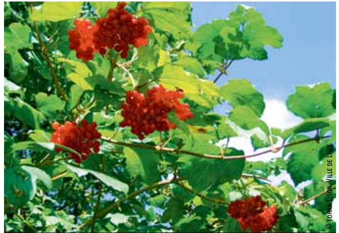
Le viorne obier, actuellement planté sur Lille, nourrit la faune des jardins, dont l'abeille mais aussi les oiseaux attirés par ses fruits.

Autres lieux concernés par de nouvelles plantations : les crèches. « Tout mètre carré d'espace vert à Lille a son rôle à jouer, remarque Yohan Tison, et donne à profiter d'une nature de proximité. » Les cours ou jardinets des structures d'accueil