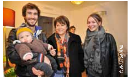
Un jeune couple discute avec le maire de Lille.

Pour les 24 logements LMH, le bâtiment collectif situé rue de Flers a pour objectif