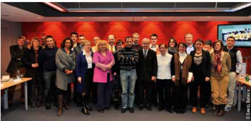
Le nouveau Conseil de quartier du Vieux-Lille.