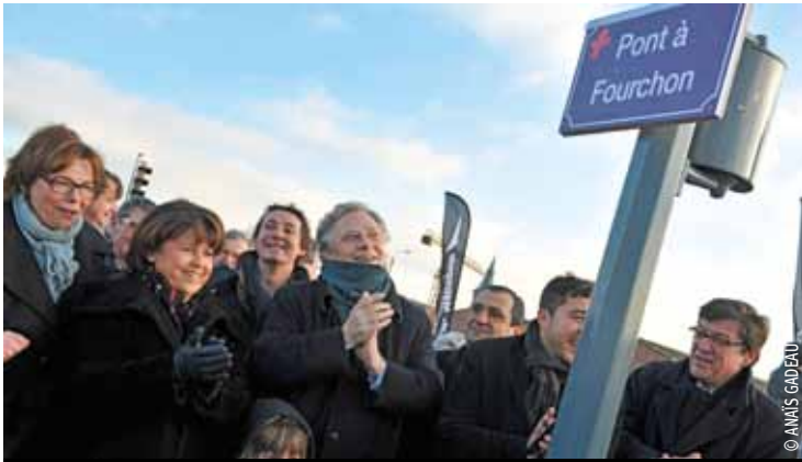
Un lien direct entre le quartier des Bois-Blancs à Lille et celui du Marais à Lomme.

Martine Aubry a inauguré le nouveau « Pont à Fourchon », construit face à Euratechnologies. Ce très bel ouvrage permet de relier le cœur des Bois-Blancs au nouveau quartier des Rives de la Haute Deûle.