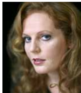
Le 1 er février, Eva Maria Westbroek , soprano, interprétera de grands airs d'opéras italiens.

accueil de qualité durant sa saison « hors les murs ». Un service de navettes aller-retour (Lille-Roubaix/Villeneuve-d'Ascq - Roubaix/Lomme-Roubaix) est ainsi à la disposition du public. Ces navettes sont gratuites, et pourront transporter le public à partir de 19 h 15, depuis trois lieux différents à proximité des stations de