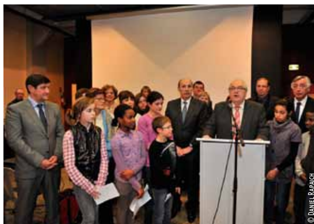
À Wazemmes, le 16 janvier.