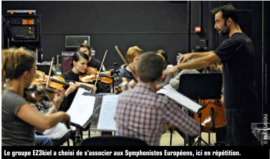
Le groupe EZ3kiel a choisi de s'associer aux Symphonistes Européens, ici en répétition.