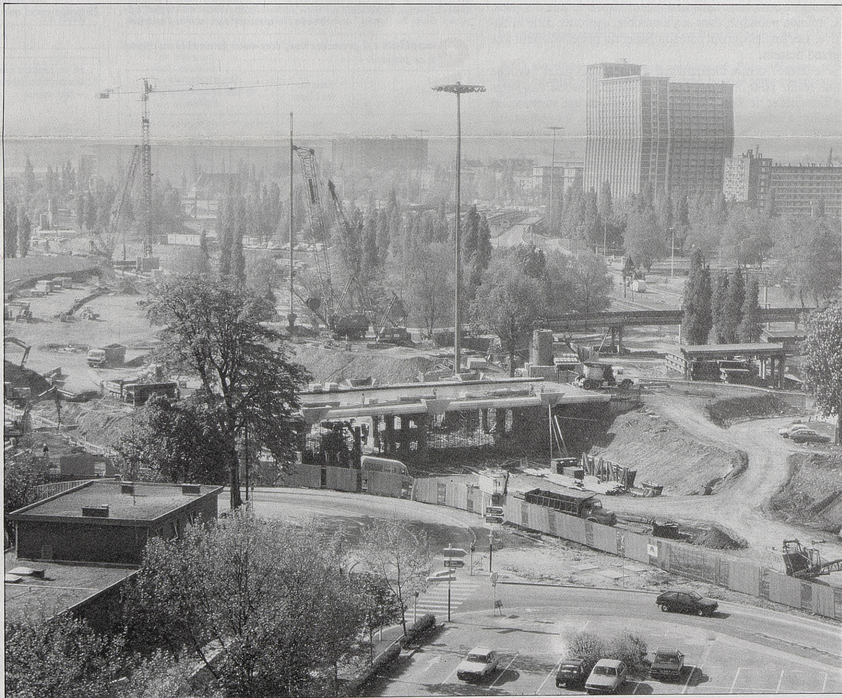
Le chantier de la gare TGV.

Au Conseil Municipal du 23 avril, Pierre Mauroy a rappelé qu'Euralille est avant tout un outil de la croissance économique de la métropole et il s'est engagé à publier un état trimestriel des créations d'emplois.