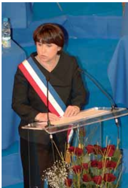
Martine Aubry, le 21 mars : « C'est cette façon de vivre ensemble à Lille qui me donne des ailes pour continuer de faire avancer notre ville. »