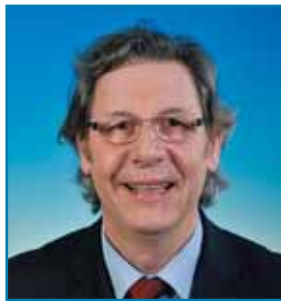
Gilles PARGNEAUX - PS Maire de la Commune associée d'Hellemmes