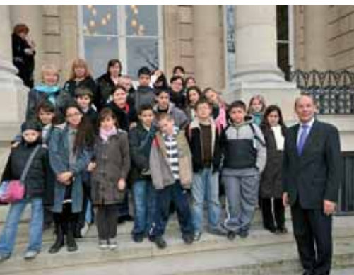
Dans la cour intérieure, photo de groupe avec le député de la 1 re circonscription, Bernard Roman.