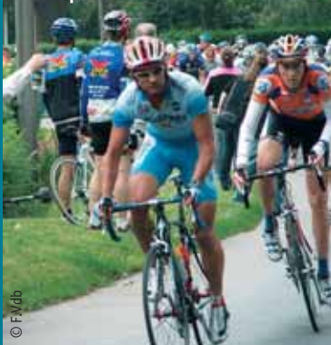
La Laurent Desbiens, la cyclo-sportive métropolitaine

La Rando VTT (20, 40 et 55 km) et la Rando Familles 59 (10 et 20 km) Rens. 03 20 49 4873 www.lechtibiketour.org Tour du Benelux du 20 au 27 août Le Grand Prix de Fourmies , le 14 septembre www.grandprixdefourmies.com Brevet des Monts de Flandres , le 14 septembre Le Guidon d'Or d'Hellemmes , le 15 septembre Grand Prix d'Isbergues , le 21 septembre Championnats du monde sur route à Varèse (ITA) du 24 au 28 septembre.