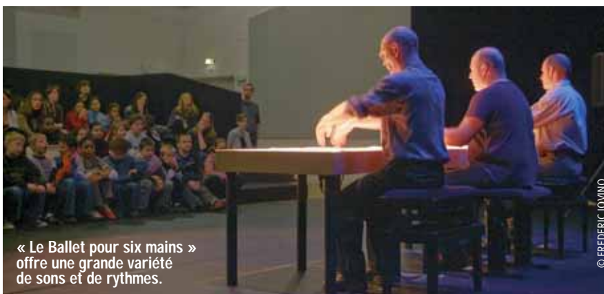
« Le Ballet pour six mains » offre une grande variété de sons et de rythmes.

Mardi après-midi, ce sont les élèves de CE2 et CM1 de l'école Chénier au Faubourg de Béthune qui voyagent d'un espace à l'autre dans ce bel Opéra. Ils explorent les lieux pour la première fois. Et participent à des ateliers précédant les concerts. Ainsi, les enfants se mettent dans le « bain » pour mieux appréhender ce qu'ils vont ensuite écouter. Ils passent ainsi du « faire à entendre », résume le Mike très applaudi. Les séances de jeux musicaux sont animées par des étudiants du Centre de formation des musiciens intervenants . Première séance : les enfants tapent sur des tables. Mais pas n'importe comment. En veillant aux rythmes et aux nuances. Ensuite, ils s'installent pour assister à la démonstration de trois percussionnistes, assis à trois tables, une partition face à chacun d'eux. Bouts des doigts frottés, paumes des mains