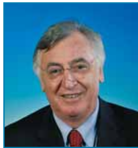
Yves DURAND - PS Maire de la Commune associée de Lomme