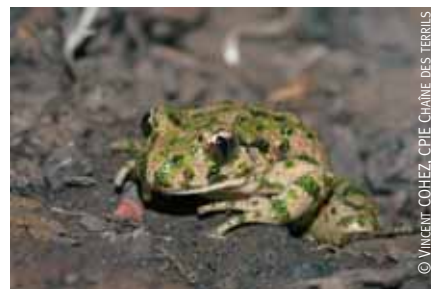
Le pélodyte ponctué.