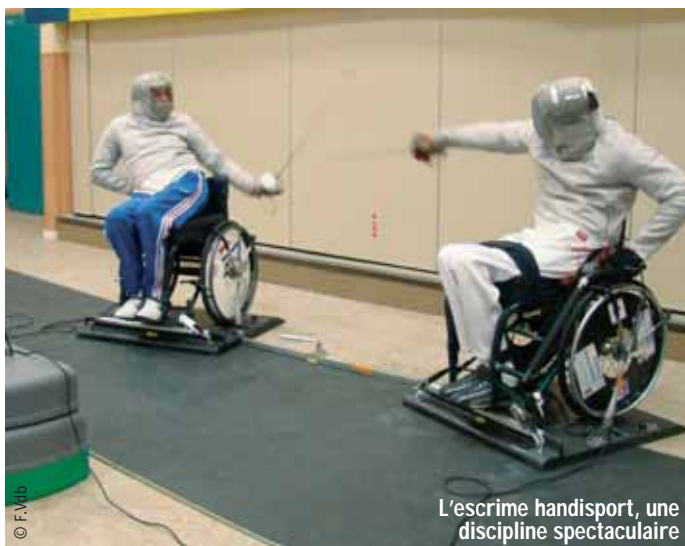
L'escrime handisport, une discipline spectaculaire