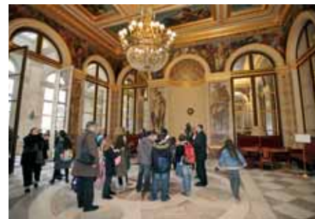
La visite des salons : impressionnant !

Cette journée a été l'occasion d'une belle leçon d'éducation civique et de décou-