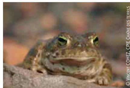
Le crapaud calamite.

Bruno Derolez : Les terrils du bassin minier proposent des sentiers pour des balades