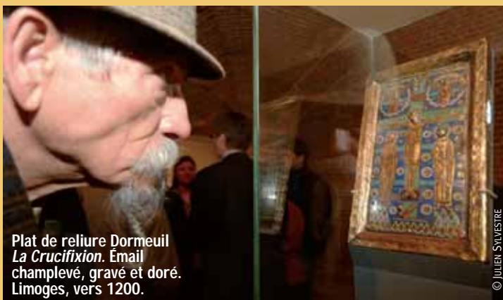
Plat de reliure Dormeuil La Crucifixion . Émail champlevé, gravé et doré. Limoges, vers 1200.

G âce aux partenariats conjoints de la Ville de Lille, de l'État (Fonds du Patrimoine) et du mécénat du Crédit du Nord, le Palais des Beaux-Arts a obtenu l'acquisition d'une œuvre d'art exceptionnelle et rare : un plat de reliure Dormeuil, La Crucifixion , datant du xii e siècle. Un plat de reliure est une « merveille » qui orne la couverture des manuscrits et celui acquis par le musée lillois était, très certainement, destinée à recouvrir un manuscrit de textes sacrés, en témoigne l'iconographie de La Crucifixion . « L'enrichissement de notre patrimoine est une nécessité. L'acquisition d'une telle œuvre d'art représente non seulement un faisceau d'histoire pour le présent mais constitue aussi le patrimoine de demain », a déclaré Alain Tapié, Conservateur en chef du Patrimoine et Directeur du Palais des Beaux-Arts, lors de la présentation de l'œuvre le 7 février 2008. ■