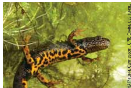
Le triton crêté.

permettant la découverte des amphibiens mais aussi d'autres espèces de faune et de flore. Le site naturel de Pinchonvalles, par exemple, le plus long terril d'Europe, est l'un des plus riches de France.