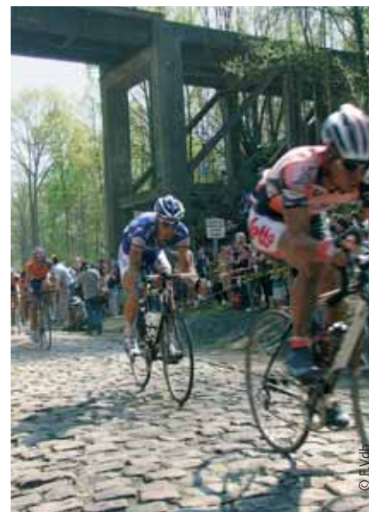
Paris-Roubaix, un grand rendez-vous pour les professionnels et les cyclotouristes.