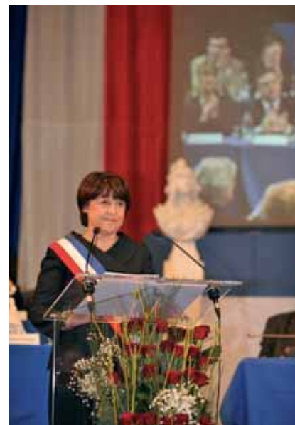
C'est avec émotion que Martine Aubry a prononcé le premier discours de son nouveau mandat, car, a-t-elle dit : « Vous le savez, j'ai Lille dans mon cœur. »