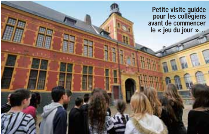
Petite visite guidée pour les collégiens avant de commencer le « jeu du jour »...