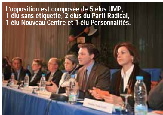
L'opposition est composée de 5 élus UMP, 1 élu sans étiquette, 2 élus du Parti Radical, 1 élu Nouveau Centre et 1 élu Personnalités.