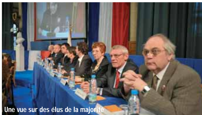
Une vue sur des élus de la majorité