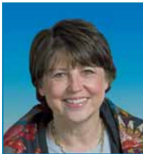
Martine AUBRY - PS Maire de Lille