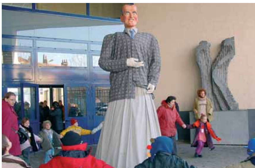
Au collège Boris Vian, les collégiens et l'équipe pédagogique peuvent travailler sur l'histoire du quartier mais aussi sur la vie et l'œuvre du célèbre écrivain (ici représenté sous forme de géant réalisé par les élèves) dont l'établissement scolaire porte le nom.

Chaque collège fourmille donc de « bonnes intentions », qui pourront prendre la forme d'une création sonore et visuelle, d'un petit journal ou de réalisations d'arts plastiques concoctés par les élèves eux-mêmes, ainsi que d'échanges, avec des aînés par exemple. Dans ce cadre, les témoignages et documents sont les bienvenus. Pour aider les collégiens à avancer dans leur projet autour de l'histoire de leur établissement scolaire, vous pouvez contacter hlegrand@mairie-lille.fr ■