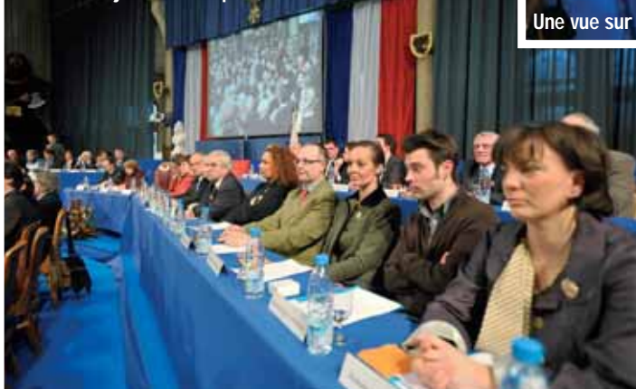
Parmi la majorité municipale, de nouveaux élus