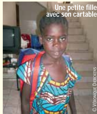
Une petite fille avec son cartable