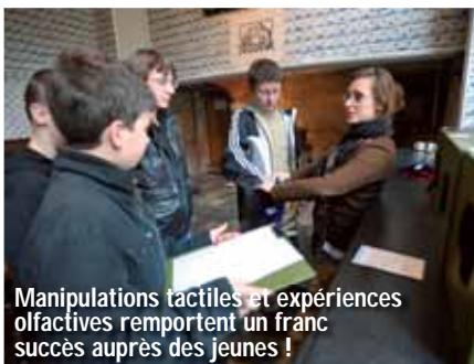
Manipulations tactiles et expériences olfactives remportent un franc succès auprès des jeunes !