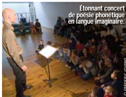
Étonnant concert de poésie phonétique en langue imaginaire.