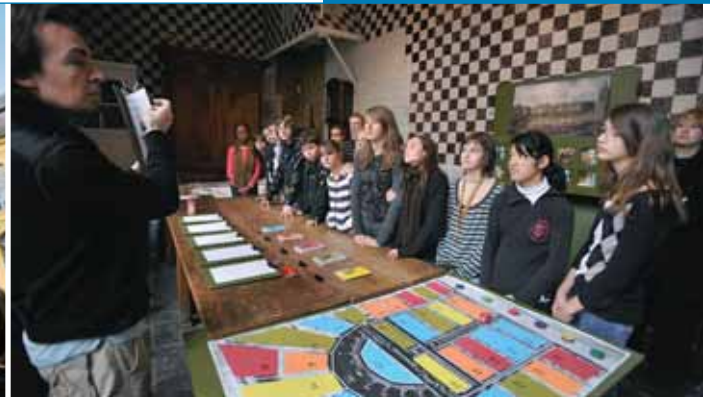
Le service Médiation du musée Comtesse propose plusieurs parcours de découvertes, dont celui du jeu de l'oie.