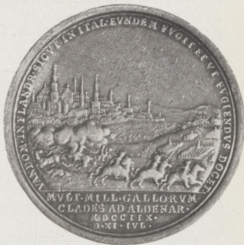
Médaille commémorative de la prise d'Oudenarde par Malborough et le Prince Eugène