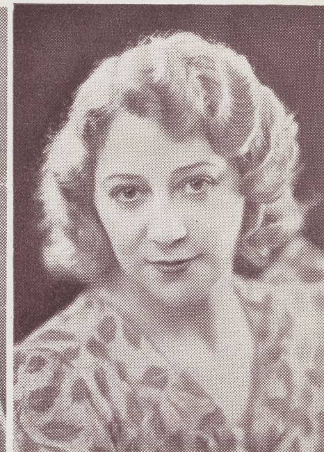
Lucienne DAUBRAY 2 me Chanteuse fantaisiste du Trianon Lyrique