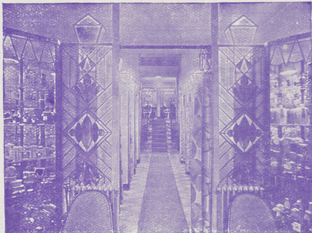
L'entrée des Salons

Même Maison : 59, rue Faidherbe, Lille - Tél. 532.42