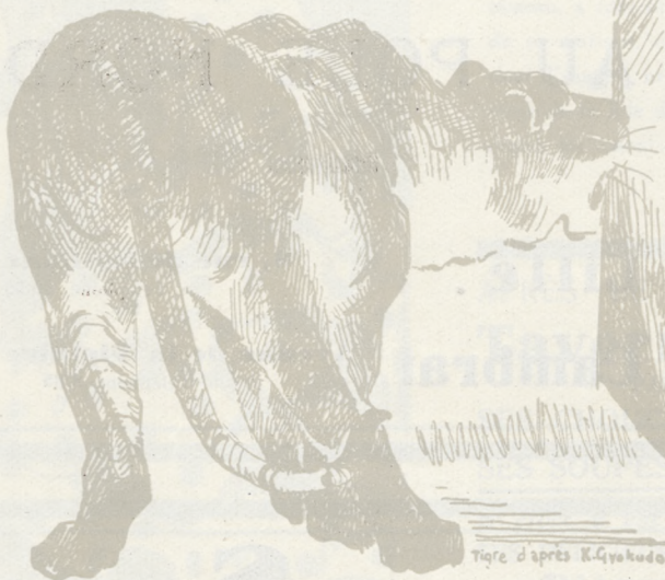
Tigre d'après K. G. Yokuda