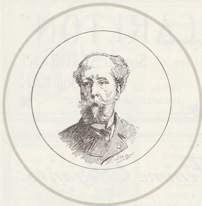
M. EDOUARD LALO L'auteur immortel du Roi d'Ys.