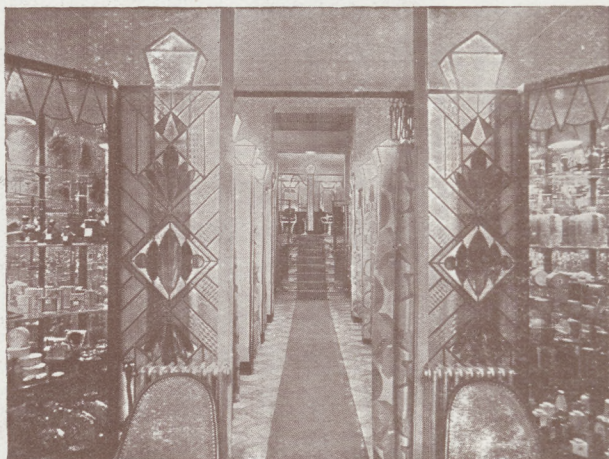
L'entrée des Salons

59, Rue Faidherbe, Tél. 31.75 et 80, Rue de l'Hôpital Militaire, Tél. 37.12, LILLE