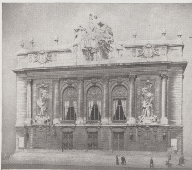
L'OPÉRA de LILLE