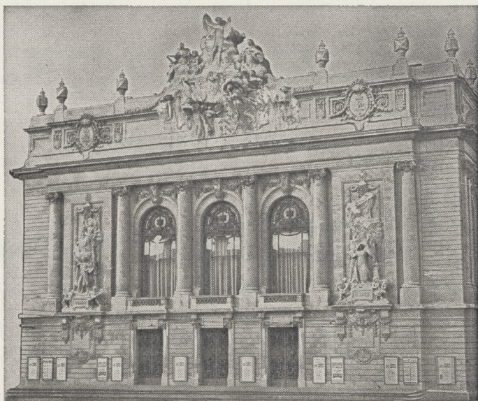
L'OPÉRA DE LILLE