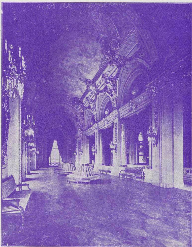
GRAND-THÉÂTRE. — LE FOYER

Pour la BIÈRE La Choucroute ET LES SPÉCIALITÉS ALSACIENNES