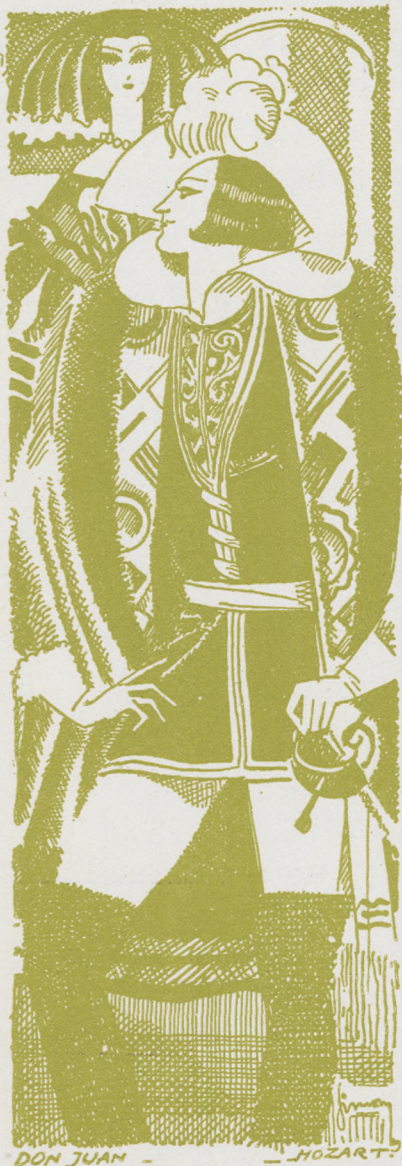
DON JUAN -