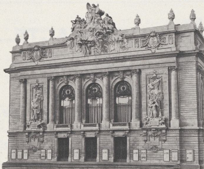
L'OPÉRA de LILLE