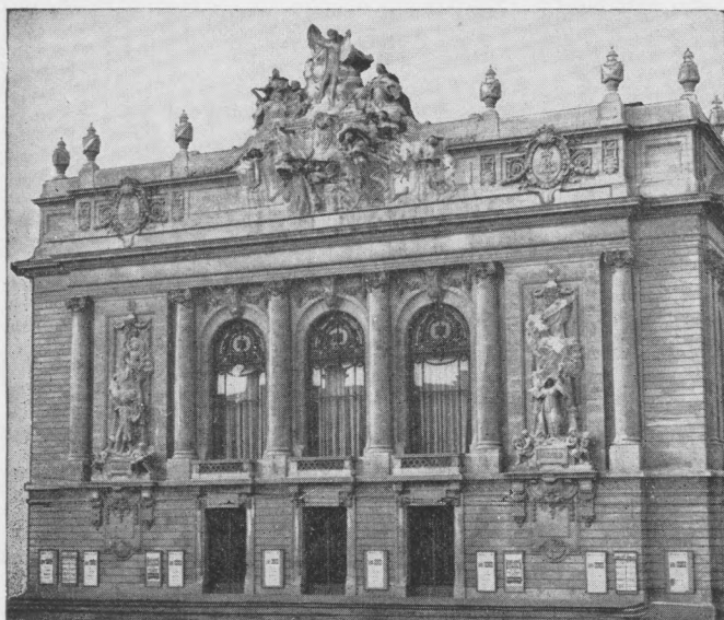
L'OPÉRA de LILLE

15, place Rihour - LILLE - Tél. 54.81.52