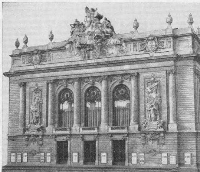
L'OPÉRA de LILLE