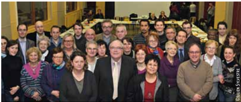
Le nouveau Conseil de quartier de Wazemmes, installé le 25 janvier.