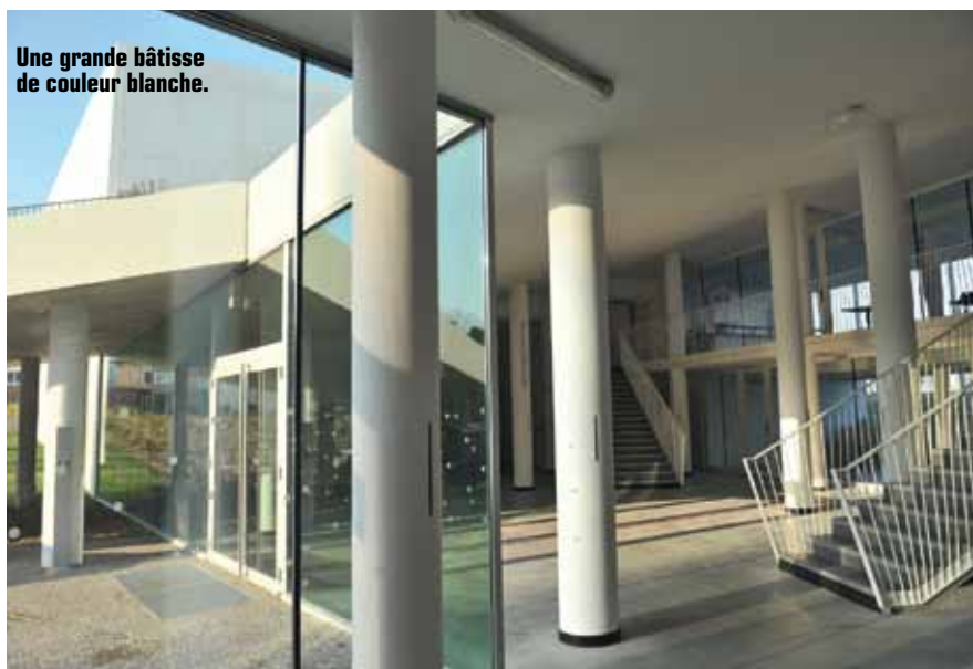
Une grande bâtisse de couleur blanche.

Avec ses entrées, boulevard de Metz et rue d'Esquermes, c'est une grande bâtisse en béton de couleur blanche. Elle se situe, ce qui l'adoucit, dans un joli aménagement paysager. Ce Jardin des Sports (5 000 m 2 ) situé à la croisée des quartiers du Faubourg de Béthune et de Wazemmes est, comme le définit Martine Aubry, un pur « joyau du sport à Lille ».