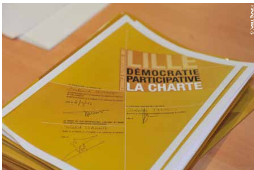
La Charte de la démocratie participative.

Chaque conseiller travaille aussi dans une ou plusieurs commissions. Cadre de vie, subventions avec le Fonds de Participation des habitants, Plan de déplacement urbain, Animation et culture, autant de commissions qui préparent les conseils, rendent des avis, font des propositions.