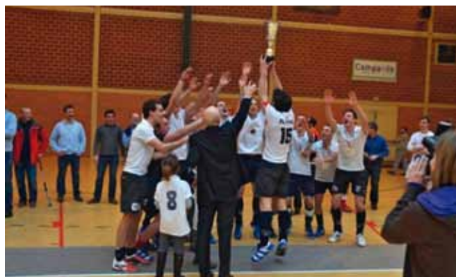
Le titre de champion de France pour les garçons.