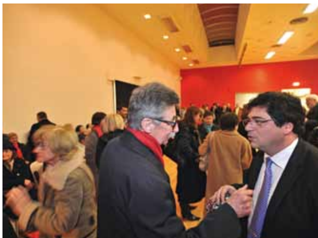
À Lille-Centre, le 19 janvier.