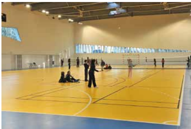
Une salle multisports.