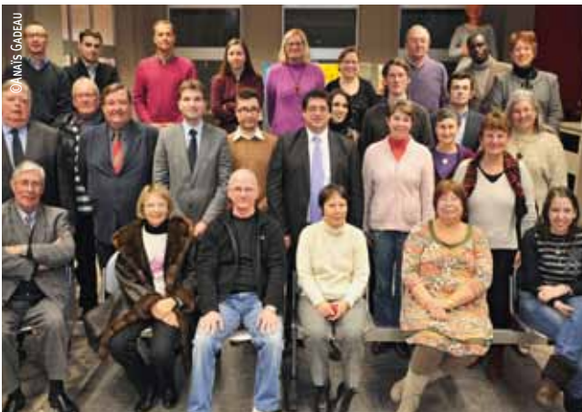
Le nouveau Conseil de quartier de Lille-Centre, installé le 2 février.