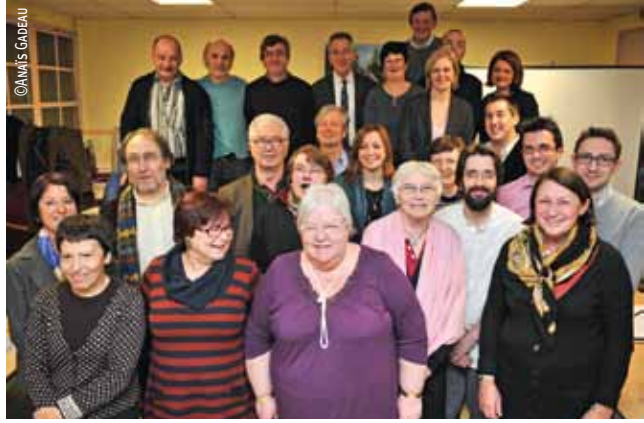
Le nouveau Conseil de quartier de Saint-Maurice Pellevoisin, installé le 24 janvier.