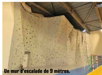
Un mur d'escalade de 9 mètres.

Sa vocation va même dépasser le Faubourg de Béthune, Wazemmes ou Vauban. C'est une structure ouverte pour tous les quartiers de la Ville . « C'est, comme le souligne Martine Aubry , un très beau projet architectural, quelque chose qui va compter. » Ce pôle d'excellence sportive pourra accueillir de nombreuses activités dans sa salle multi-sports : basket, handball, volley, futsal... Mais d'autres pratiques pourraient aussi