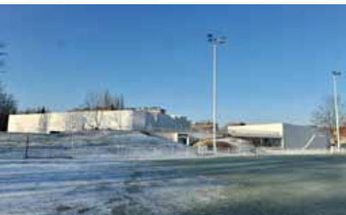
Un équipement implanté dans les quartiers.