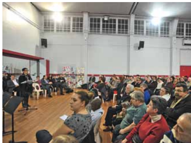
Au Faubourg de Béthune, le 23 janvier.