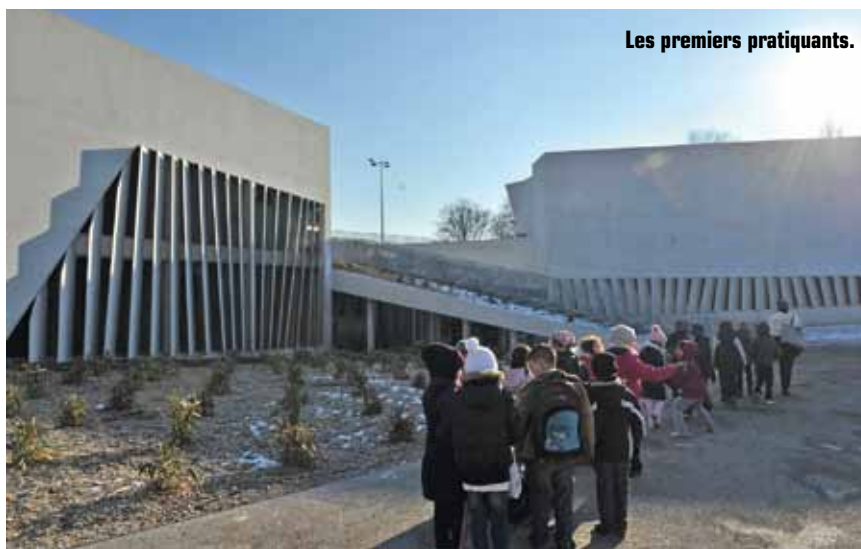
Les premiers pratiquants.

Le Jardin des Sports fait partie d'un ensemble de structures de haut niveau au sein de la ville. Il rejoint la Halle de Glisse (Lille-Sud), la Halle Jean Bouin (Moulins), le Lille Métropole Hockey Club mais aussi le stade Léo Lagrange (Faubourg)... D'autres pôles d'excellence sont en projet, comme le futur complexe de tennis Marcel Bernard (Faubourg), la piscine de Lille-Sud ou la Plaine des Sports (Vieux-Lille), issue de la requalification de la Citadelle, en attendant les travaux de rénovation de Marx Dormoy (Bois-Blancs). N'oublions pas non plus tous les équipements de proximité. Ils sont l'image d'une cité où le sport a un bel avenir... ■