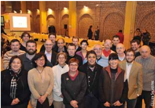
Le nouveau Conseil de quartier de Moulins, installé le 31 janvier.