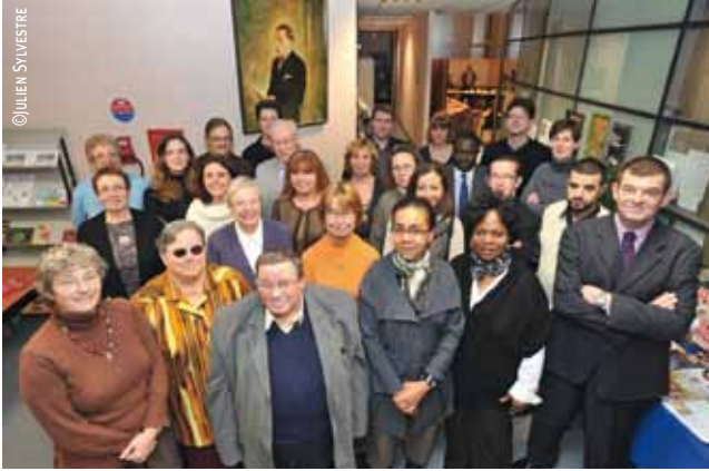
Le nouveau Conseil de quartier de Lille-Sud, installé le 19 janvier.

Les Conseils de quartier de Lille, au nombre de dix, comprennent un président et un nombre de membres déterminé en fonction de la population du quartier : 24 membres pour Bois-Blancs et le Faubourg de Béthune , 39 membres pour le quartier du Centre , 30 membres pour Fives , Lille-Sud , Moulins et Vauban-Esquermes , 27 membres pour Saint-Maurice Pellevoisin et le Vieux-Lille et enfin 39 membres pour Wazemmes .