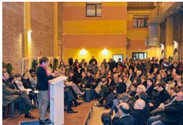
À Moulins, le 17 janvier.

Comme chaque année en janvier, les président(e)s de Conseils de quartier présentent leurs vœux à la population dans chacun des quartiers. Un moment convivial, mais aussi l'occasion de faire le point sur l'avancement des projets. Vous en trouverez le compte rendu dans les éditions de quartier de Lille magazine.