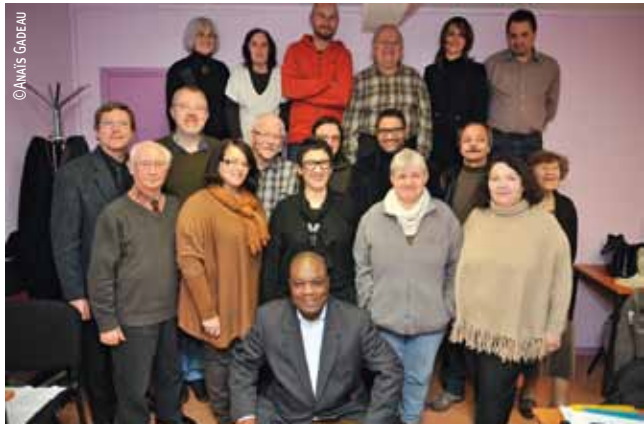
Le nouveau Conseil de quartier de Faubourg de Béthune, installé le 1 er février.