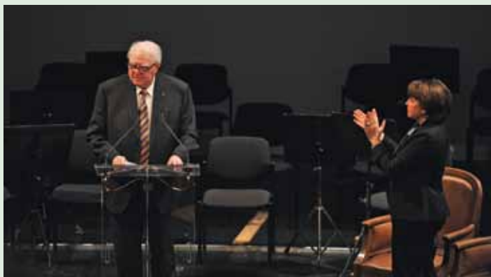
À la fin de son discours, tout l'Opéra s'est levé pour applaudir Pierre Mauroy.