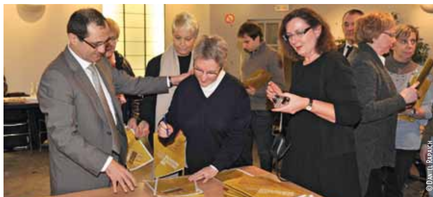
Les conseillers de quartier signent la Charte.