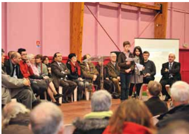
À Saint-Maurice Pellevoisin, le 26 janvier.