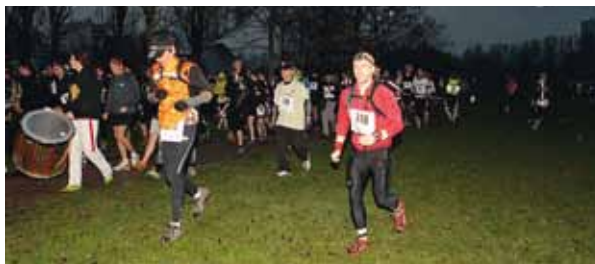
10 e Trail des Remparts lillois.

L'association Seven Sport Extrême Pour Tous organise avec la Ville de Lille la 10 e édition du Trail des Remparts le 16 mars (à 19 h) et le 7 e Lill'Raid les 10 et 11 mars . Pour ces deux événements, des nouveautés sont à découvrir. Le Trail des Remparts emprunte sur ses trois parcours (8 km, 14 km ou 22 km) plus de 90 % de chemins et de sous-bois, en ne traversant que trois routes... Il met également en valeur le patrimoine historique de Lille, avec ses remparts et son bois de la Citadelle. Pour le Raid, le principe est simple. Après avoir reçu le Road Book, le départ sera donné à Lille. Il faudra parfois courir, rouler, chercher des balises, naviguer, grimper, sauter, faire du tir à l'arc... Et cela toujours dans un esprit sportif et d'aventure, avec des épreuves surprises, des épreuves à sensations, des épreuves de réflexion. Deux belles épreuves pour les amoureux du sport nature ! ■