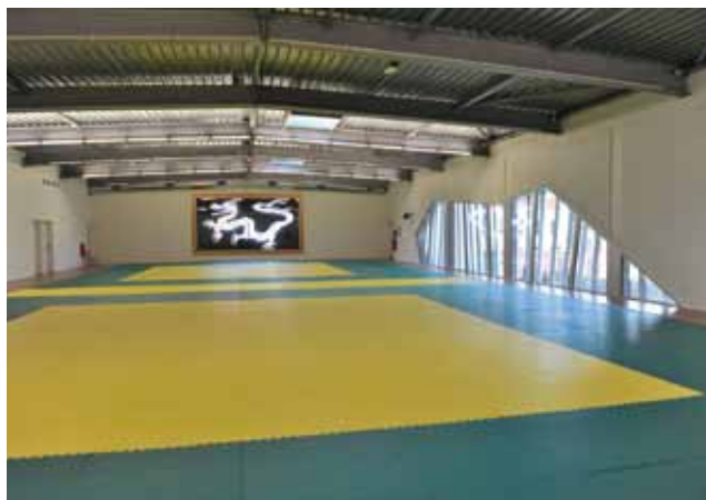
L'un des deux magnifiques dojos.