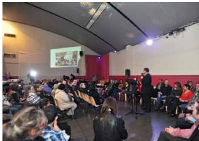
À Lille-Sud, le 27 janvier.