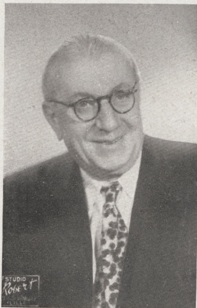
Louis GUENOT , de l'Opéra-Comique Directeur des Théâtres Municipaux de Lille