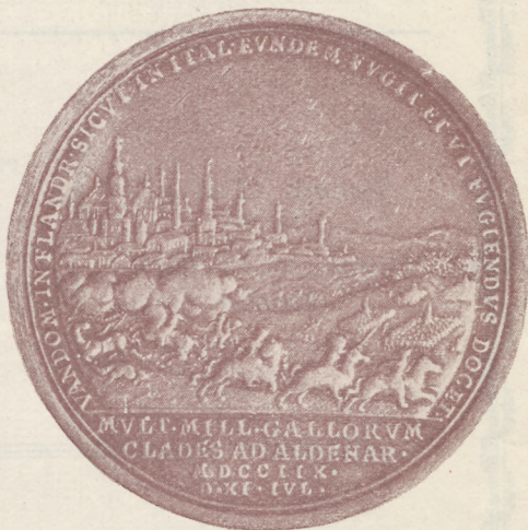
Médaille commémorative de la prise d'Oudenarde par Malborough et le Prince Eugène (Collection de M. Décamps-Bridelance)

dix mille hommes alors que les alliés en laissèrent le double sur le champ de bataille.