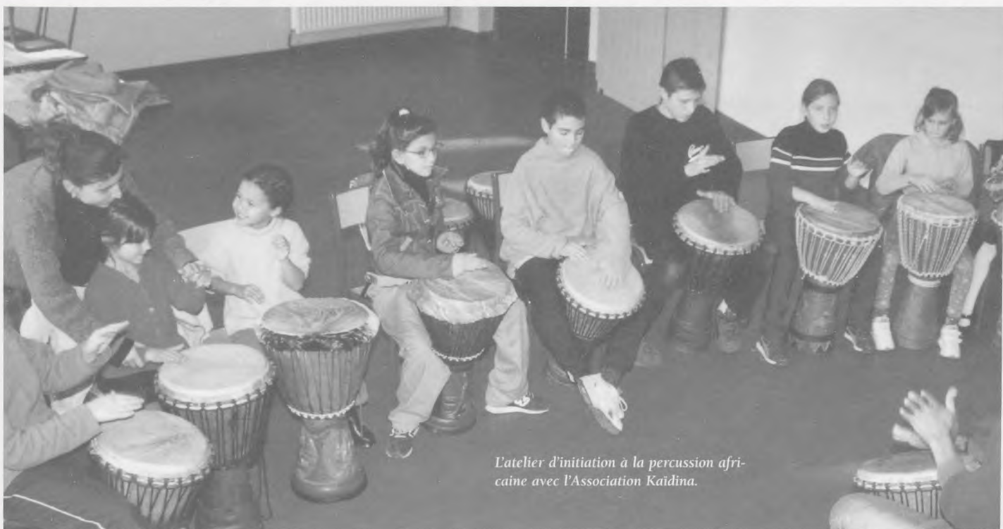
L'atelier d'initiation à la percussion africaine avec l'Association Kaidina.

Maison de Quartier : 77, rue Roland à Lille et pour tous renseignements le numéro de téléphone est le suivant : 03 20 22 89 07.