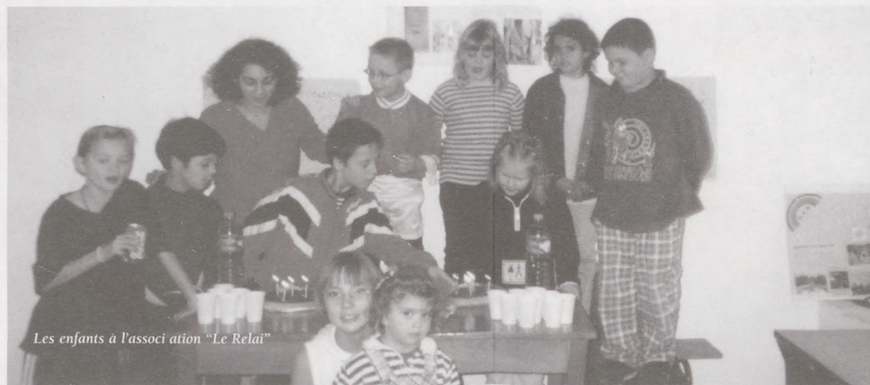
Les enfants à l'association "Le Relais"