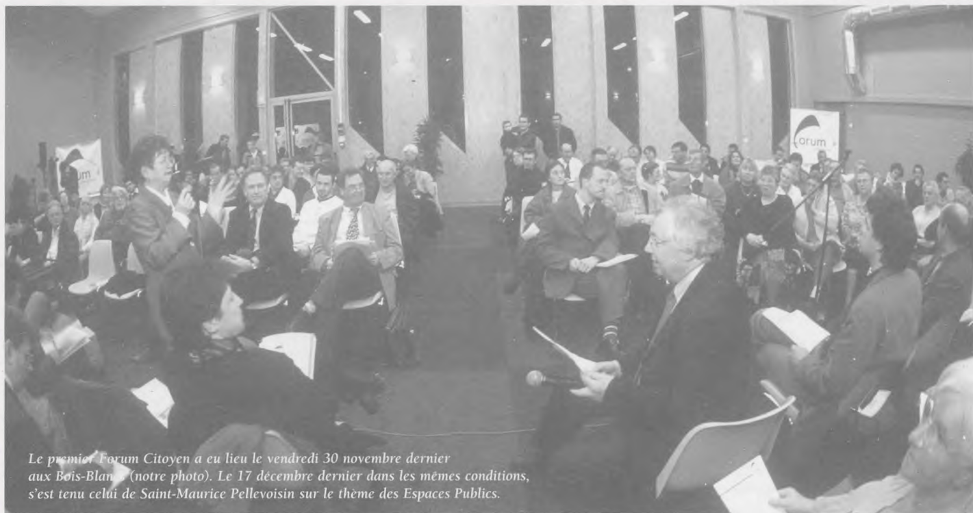
Le premier Forum Citoyen a eu lieu le vendredi 30 novembre dernier aux Bois-Blancs (notre photo). Le 17 décembre dernier dans les mêmes conditions, s'est tenu celui de Saint-Maurice Pellevoisin sur le thème des Espaces Publics.