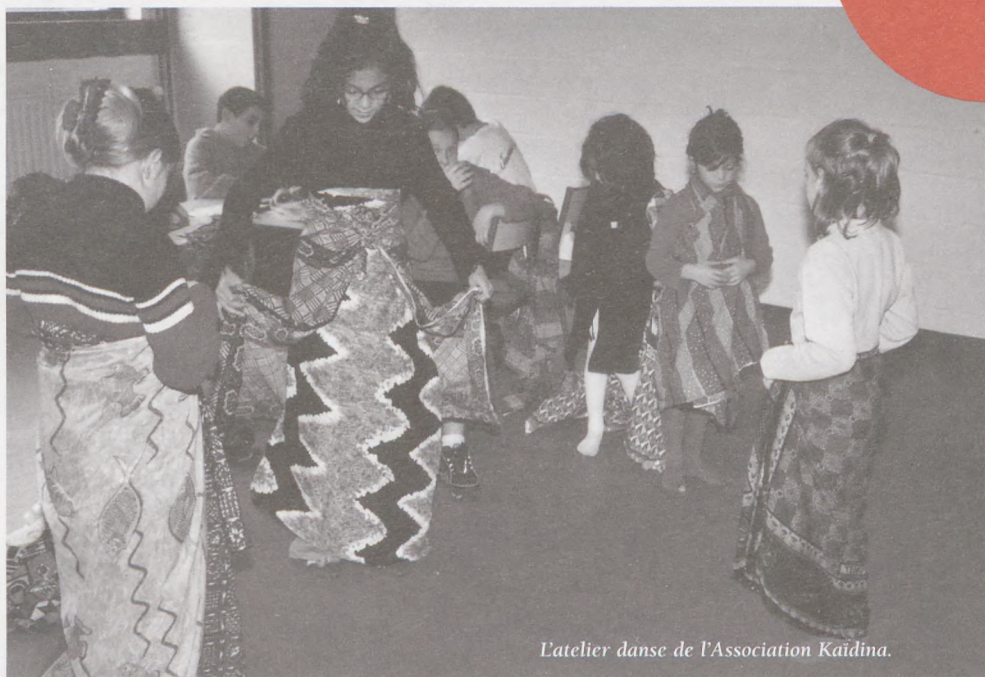
L'atelier danse de l'Association Kaidina.

Comme promis la Maison de Quartier a ouvert ses portes fin octobre 2001 avec un programme varié.