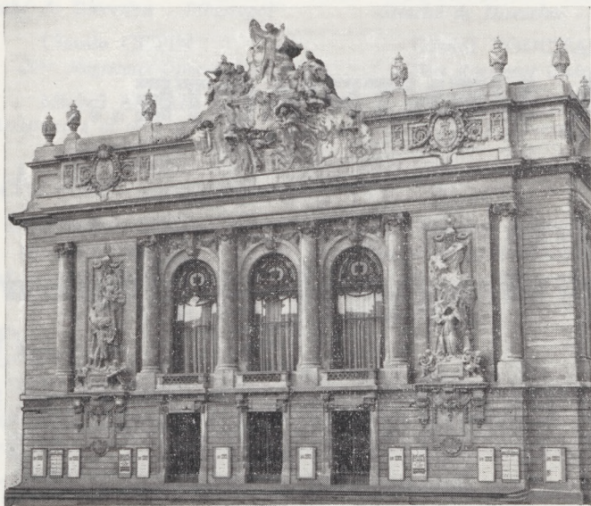
L'OPÉRA de LILLE