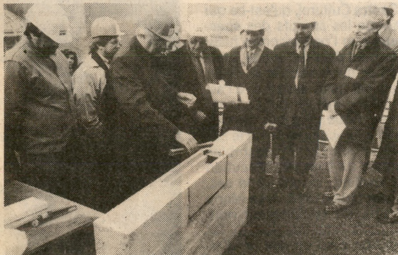
C'est au pied du mur qu'on reconnaît le maçon...

Lille évoquait également la relance du marché immobilier sur la place lilloise, une relance amorcée selon lui par la politique immobilière menée par la municipalité ces dernières années (échanges compensés avec l'armée, l'évêché, etc). Pour Pierre Mauroy, il est significatif que les appartements de standing proposés par groupe Pelège aient déjà trouvé preneurs.