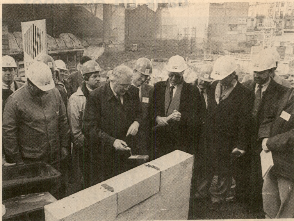
Devant le trou de l'ancienne Bourse du travail, une première pierre qui sera suivie de beaucoup d'autres... (Ph. « V.D.N. »).

R UE Gambetta, la Bourse du travail a disparu. L'ancien couvent du XIX e , après avoir perdu ses Dominicains en 1906, ses syndicalistes quatre vingt ans plus tard, a fini par disparaître lui-même. Victime du progrès et du succès d'une ville qui vit "une des périodes les plus prospères depuis la guerre" selon le maire lui-même. La preuve : sur les 6.000 m 2 de terrain, occupés naguère par la Bourse du travail, entre les rues Gambetta et d'Inkermann, on