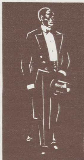
Beau blanc sur beau noir

Succursales ROUBAIX : 16, rue Saint-Georges AMIENS : 7, rue de la République Téléphone 56