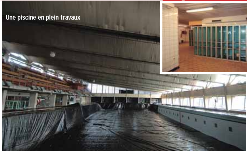
Une piscine en plein travaux

A u début du mois d'août, la piscine Marx Dormoy s'est offert un « petit lifting » avant la rentrée. Sa réouverture est prévue pour la fin du mois de septembre. Les travaux visent à aménager des cabines supplémentaires dans les vestiaires, à renouveler les portes des casiers et à rénover le plafond au-dessus du grand bassin et des gradins. ■