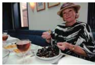
Pas de braderie sans moules se dégustant du bout des doigts ou « à la pince », comme ici par la baronne Nadine de Rothschild.