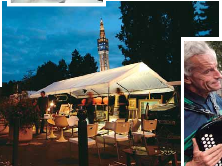
La douceur de la nuit n'éteint pas la fièvre acheteuse.