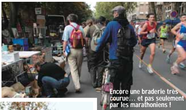
Encore une braderie très courue... et pas seulement par les marathoniens !