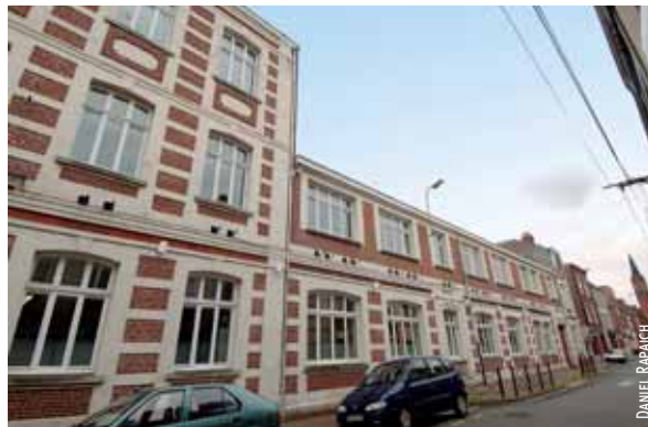
À l'école Turgot, à 15 h, départ du parcours « Prémices et évolution de l'habitat social » : courées, Cité des Fleurs, Habitations à bon marché (HBM), grands ensembles HLM, 150 ans de l'histoire du quartier.