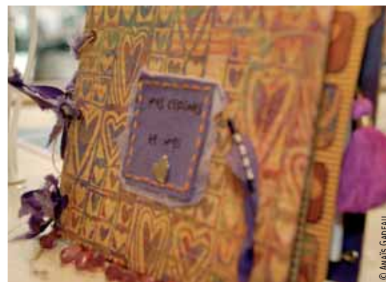
Album photos personnalisé... Tout se scrape !