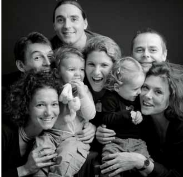
Portrait de famille par Delphine Chenu.

Delphine Chenu. Tél : 03 20 73 35 82 ou 06 18 42 07 44. Contact@portrait-sensible.fr www.portrait-sensible.fr Prochaine exposition le 4 octobre au salon « Thierry Lothmann » 175, avenue de la République à La Madeleine.