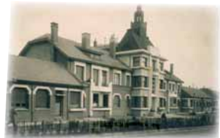
Quelques images de Lille-Sud, dans les années 30