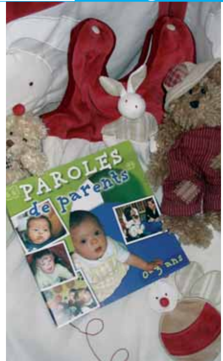
Un premier livret a été édité par les Papillons Blancs pour aider les familles dont l'enfant est né trisomique.