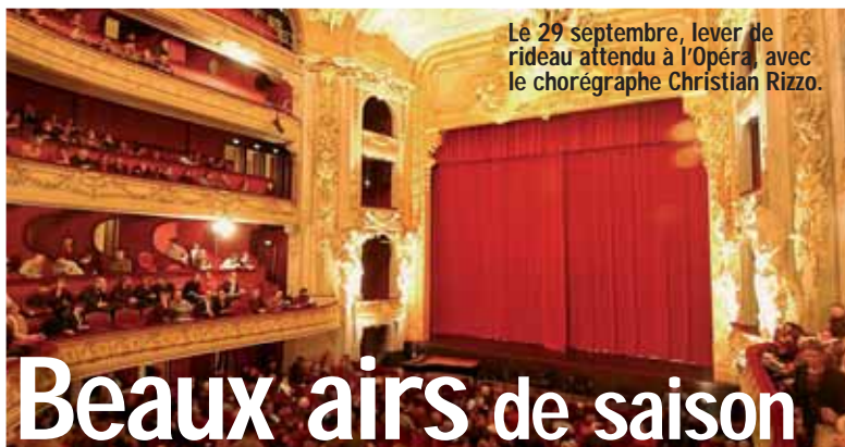
Le 29 septembre, lever de rideau attendu à l'Opéra, avec le chorégraphe Christian Rizzo.

■ Du 16 octobre 2007 au 1 er janvier 2008, Tri Postal