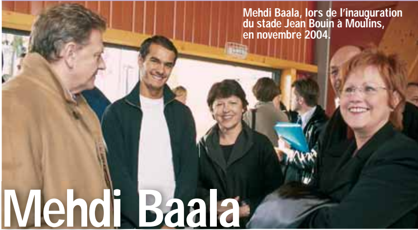
Mehdi Baala, lors de l'inauguration du stade Jean Bouin à Moulins, en novembre 2004.