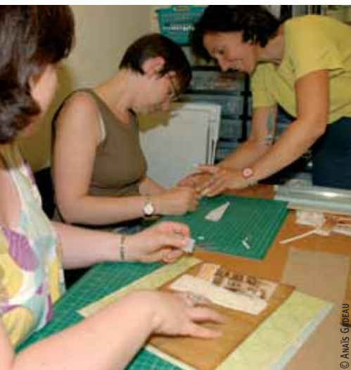
Des ateliers sont proposés pour débutantes ou scrapeuses confirmées.

tes de rangement, cadres, abats-jour, vêtements..., tout se scrape, même le transistor de la boutique. Marielle propose des ateliers pour débutantes ou scrapeuses confirmées. Elle conseille et partage sa passion avec ses clientes « locales » mais aussi les nombreuses « scraptouristes » de passage dans la région. « C'est le comble ! Depuis que j'ai tout sous la main pour scraper, je n'en ai plus le temps... » ■