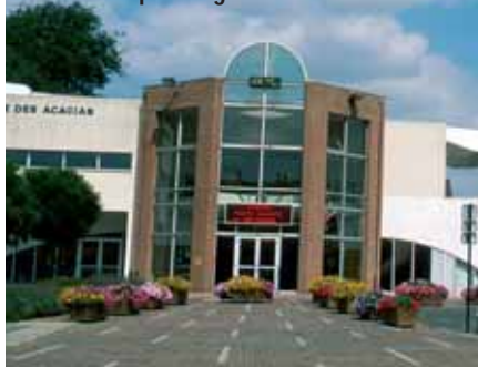
À Hellemmes, l'espace des Acacias, avec à l'arrière-plan l'église Saint-Denis.