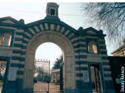
Rendez-vous à l'entrée du cimetière à 15 h pour participer à ce « parcours sentimental ».