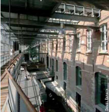
La préfecture du Nord, installée dans l'ancien hôpital militaire.

• Fives : L'arrivée du chemin de fer au XIX e siècle favorise l'implantation d'usines (Fives-Cail en 1861, Peugeot en 1898...) et une architecture typique (courées, habitat ouvrier...). Fives étant mis à l'honneur