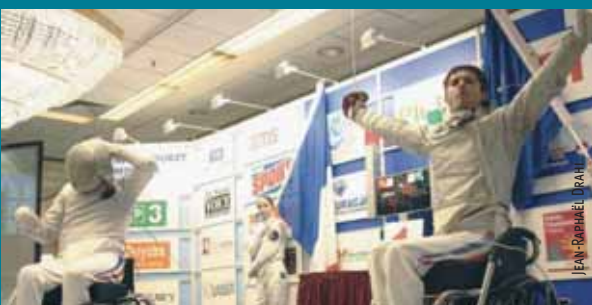
Premier titre au sabre, une sacrée victoire

1/09/07 - 7 e journée : Rennes – LOSC 15/09/07 - 8 e journée : LOSC – Bordeaux 22/09/07 - 9 e journée : Lyon – LOSC