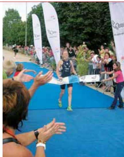
O.S.M. Lomme Natation Triathlon 433 bis, avenue de Dunkerque à Lomme. Tél : 03 20 92 55 59. http://perso.wanadoo.fr/lommenattri