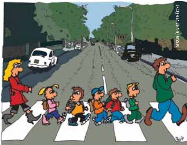
DESSIN OLIVIER VER ECKE

P our cette rentrée scolaire, la Ville de Lille renforce son action Pédibus. Il s'agit d'un ramassage scolaire non polluant, économique et solidaire : un groupe d'enfants est emmené à l'école à pied par des parents qui les encadrent à tour de rôle, tout au long d'un circuit jalonné d'arrêts pour récupérer d'autres enfants qui rejoignent le « convoi ». La distance maximale raisonnable entre le domicile et l'école est d'environ 1,5 km (à noter qu'1 km est le trajet moyen en milieu urbain que les parents effectuent en voiture jusqu'à l'école). Le Pédibus, c'est donc du temps gagné pour les parents puisque la conduite à l'école est partagée et c'est le moyen idéal pour les enfants d'arriver à l'école bien réveillés en ayant fait de l'exercice. Une convivialité se crée aussi entre les parents qui y participent. Quel-