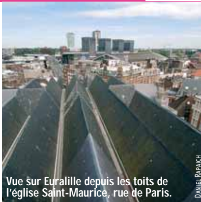
Vue sur Euralille depuis les toits de l'église Saint-Maurice, rue de Paris.