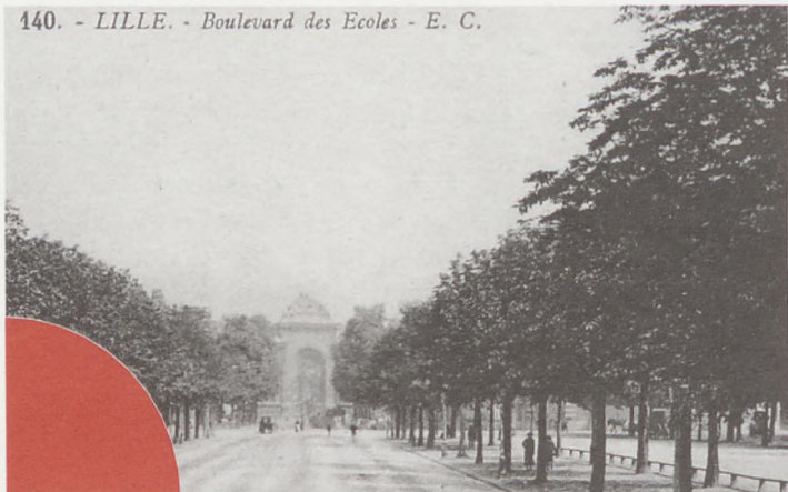
140. - LILLE. - Boulevard des Ecoles - E. C.