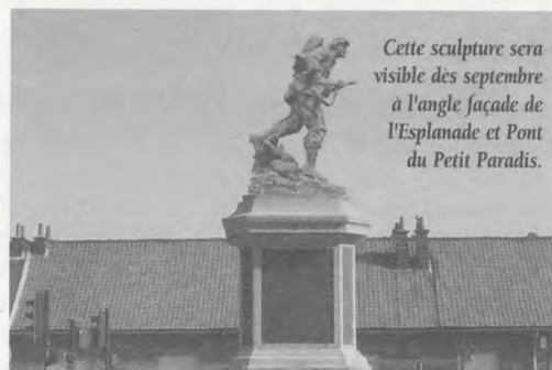
Cette sculpture sera visible dès septembre à l'angle façade de l'Esplanade et Pont du Petit Paradis.