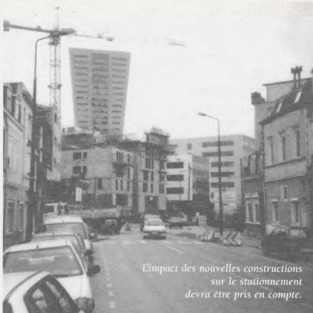
L'impact des nouvelles constructions sur le stationnement devra être pris en compte.

Point principal, et ô combien sensible, de l'ordre du jour du Conseil de Quartier : le stationnement