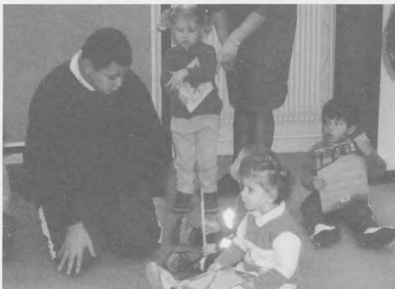
Quand nous allons au collège Jean Macé, les élèves de 6e nous lisent des albums.