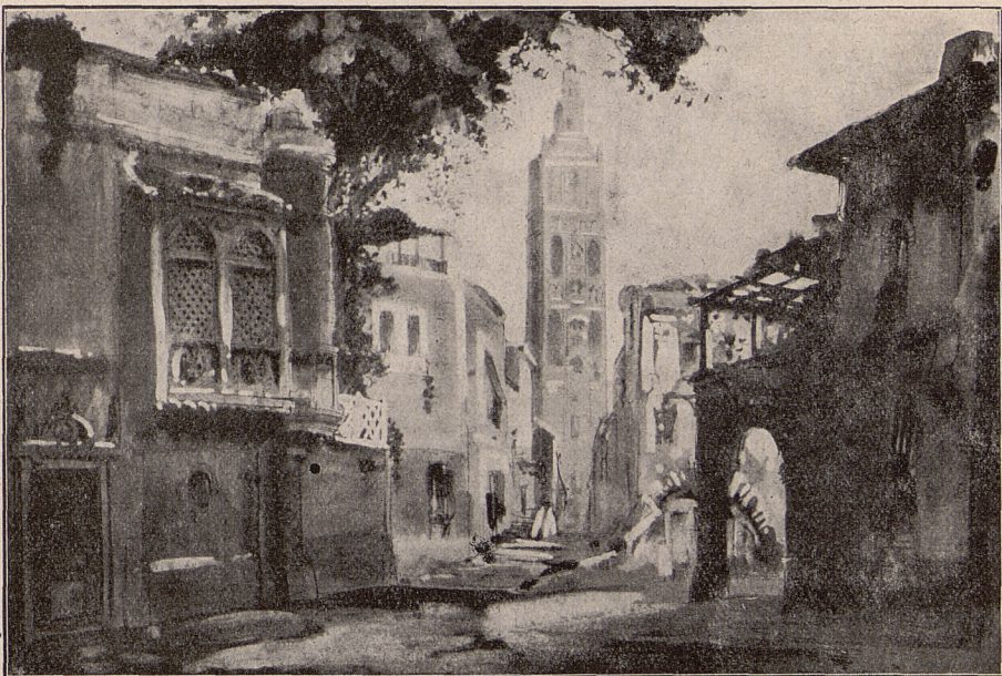
Le Barbier de Séville

A la demande de nombreux habitués du GRAND THÉÂTRE , et dans le but de donner satisfaction au public, la location pour les représentations du Dimanche, au GRAND THÉÂTRE sera dorénavant ouverte le MERCREDI au lieu du JEUDI .