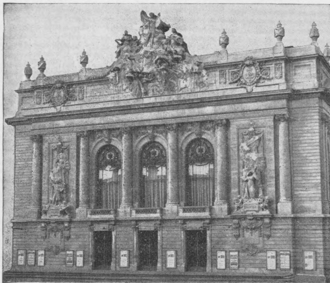
L'OPÉRA de LILLE

15, place Rihour - LILLE - Tél. 54.81.52