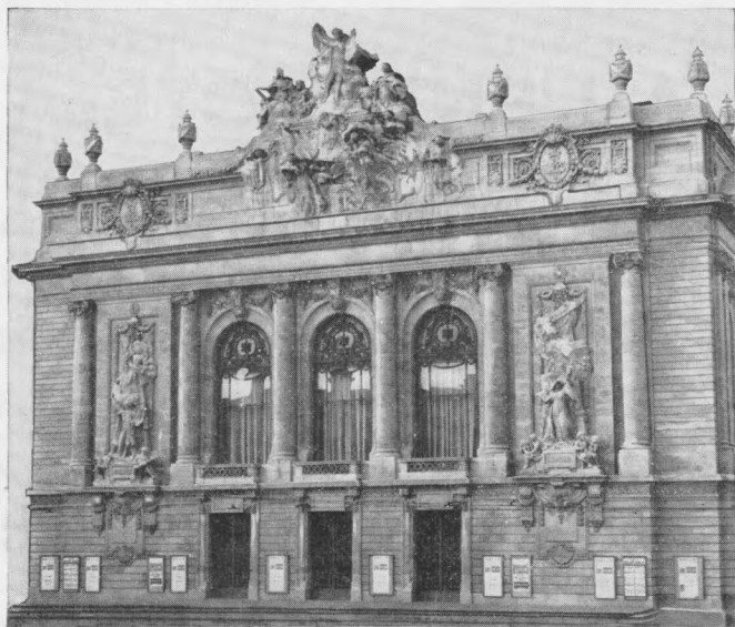
L'OPÉRA de LILLE