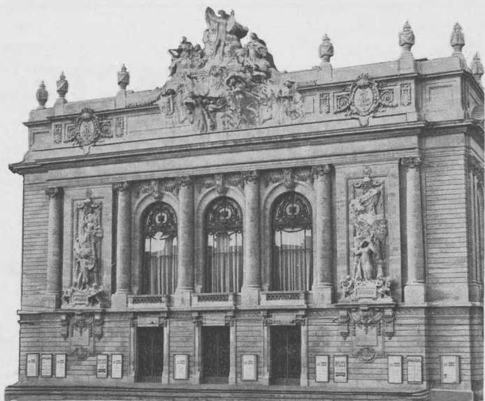
L'OPÉRA de LILLE