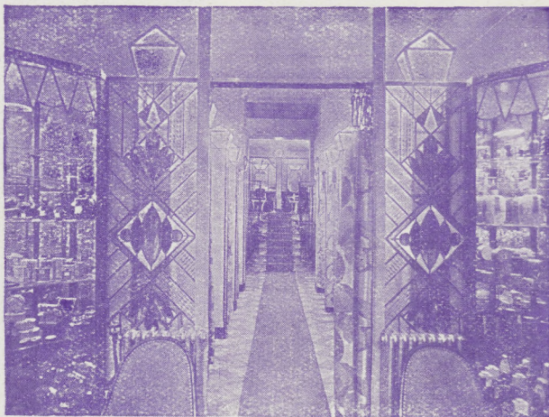
L'entrée des Salons

Même Maison : 59, rue Faidherbe, Lille - Tél. 532.42