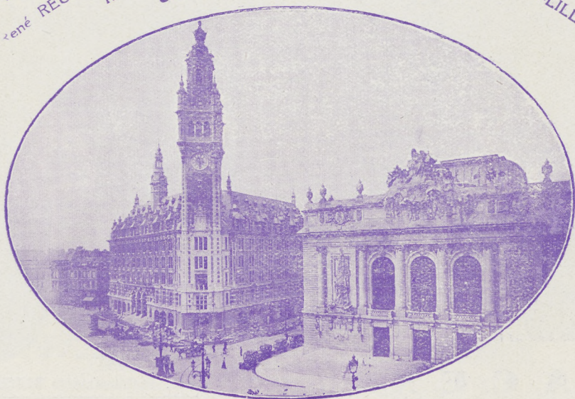
LE THÉÂTRE ET LA BOURSE