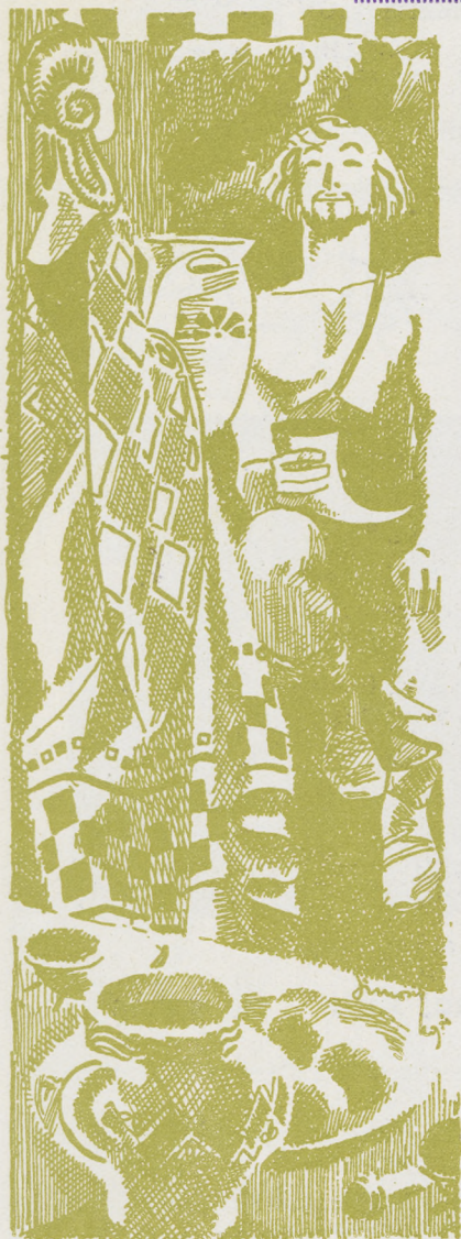
LA WALKYRIE WAGNER

Orchestre - Bar Américain - Souper après Théâtre