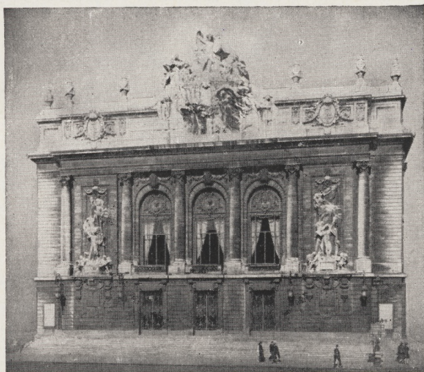
L'OPÉRA de LILLE