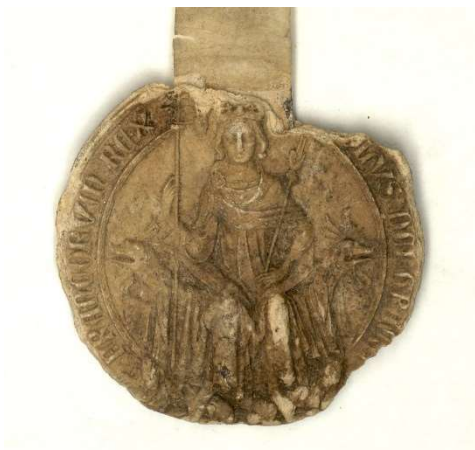
Sceau du roi de France Charles V (1368)

Les Archives de Lille conservent de nombreux sceaux de comtes, seigneurs et rois. Les plus anciens datent du XII ème siècle.