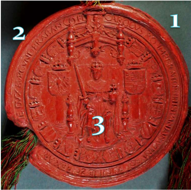
Sceau de l'empereur Charles Quint (1533)