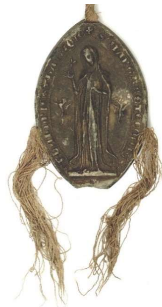
Sceau de la comtesse de Flandre Marguerite de Flandre (1267)